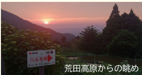
荒田高原からの眺め