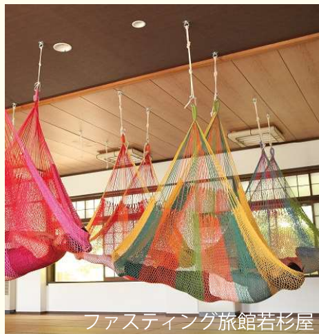
ファスティング旅館若杉屋