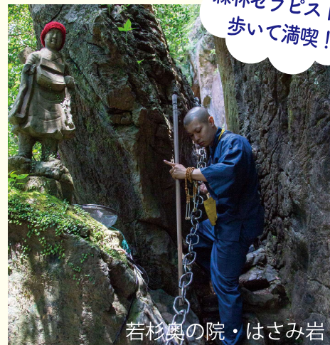
若杉奥の院・はさみ岩