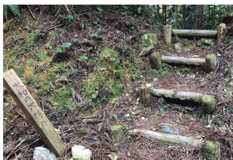
大和の大杉入り口 (大和の大杉まで徒歩 10 分程度)