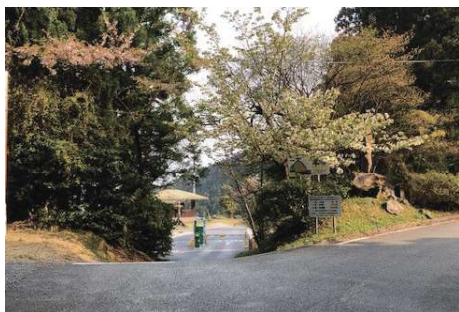
若杉楽園キャンプ場 (大和の森遊歩道から歩いて 1 分)