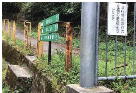
若杉楽園キャンプ場前 (ここがコンクリート道の入り口)