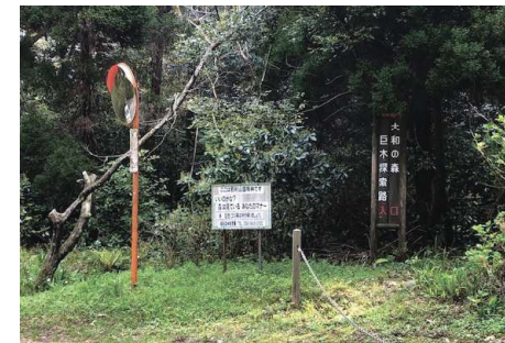
大和の森遊歩道入り口 こちらが巨木めぐりの入り口です。