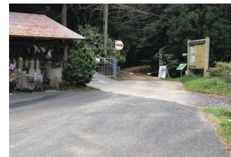
落陽コース前駐車場 (大和の大杉まで徒歩 15 分程度)