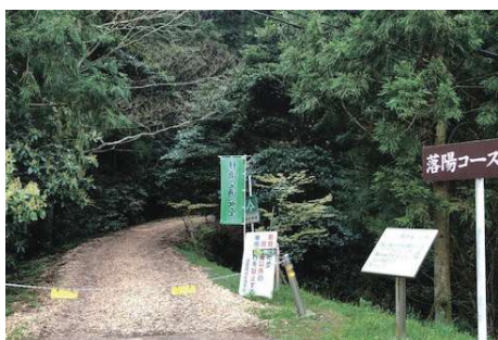
落陽コース入り口 (車両禁止のチェーンがあります)