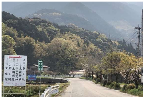
若杉登山口 (篠栗駅前から車で 8 分程度)